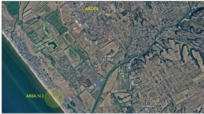
PLANIMETRIA GENERALE PER INDIVIDUAZIONE AREA